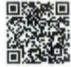
หนังสือแจ้ง ผู้ว่าราชการจังหวัดฯ

และเทศบาลตำบลนาข่า อำเภอเมือง จังหวัดสระบุรี ตำบลดาวเรือง หรือตำบลนาโง อำเภอเมือง และเทศบาล ตำบลตะกุด อำเภอเมือง จังหวัดนครสวรรค์ ตำบลปางสวรรค์ อำเภอชุมตาบง และเทศบาลนครนครสวรรค์ อำเภอเมือง หรือ เทศบาลเมืองตากลี อำเภอตากลี ในการสนับสนุนดำเนินการเพื่อจัดทำแนวทางการร่วมมือ เพื่อพัฒนาพื้นที่ต้นแบบการลดความยากจนและพัฒนาคนทุกช่วงวัย นำไปสู่การขยายผลในพื้นที่อื่นที่มีความสอดคล้องกับภูมิสังคมและบริบทของพื้นที่ต่อไป เพื่อให้ประชาชนกลุ่มเป้าหมายได้รับการแก้ปัญหา และพัฒนาอย่างตรงจุด และให้สามารถ “อยู่รอด พอเพียง และยั่งยืน” รวมถึงยังเป็นการ สนับสนุนการขับเคลื่อนแผนพัฒนาเศรษฐกิจและสังคมแห่งชาติ ฉบับที่ ๑๓ ที่เชื่อมโยง การพัฒนาจากประเทศสู่ชุมชนและจากชุมชนสู่ประเทศผ่านการขับเคลื่อนแผนพัฒนา ฉบับที่ ๑๓ แบบบูรณาการในระดับตำบลอีกด้วย โดยสามารถติดตามรายละเอียด การดำเนินการที่เกี่ยวข้องกับ ศจพ. ได้ที่ http://nsc.ncsdc.go.th/pelcd/