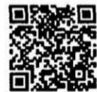
หนังสือแจ้ง ผู้ว่าราชการจังหวัดฯ

๒.๒ ความก้าวหน้าแผนการปฏิรูปประเทศ สำนักงานฯ ขอสรุปรายงานความคืบหน้าในการจัดทำ/ปรับปรุงกฎหมายที่ระบุไว้ในแผนการปฏิรูปประเทศ (ฉบับปรับปรุง) ทั้ง ๑๓ ด้าน โดยมีจำนวนรวมทั้งสิ้น ๔๕ ฉบับ มีสถานะการดำเนินการสิ้นสุด ณ เดือนตุลาคม ๒๕๖๕ สรุปได้ดังนี้ กฎหมายที่ดำเนินการแล้วเสร็จมีผลบังคับใช้แล้ว ๙ ฉบับ ได้แก่ ๑) พระราชบัญญัติการเข้าชื่อเสนอกฎหมาย พ.ศ. ๒๕๖๔ ๒) ระเบียบกระทรวงมหาดไทยว่าด้วยคณะกรรมการชุมชนของเทศบาล พ.ศ. ๒๕๖๔ ๓) ประกาศกฎ ก.พ. ว่าด้วยการพัฒนาและทดสอบนวัตกรรมด้านการบริหารทรัพยากรบุคคล พ.ศ. ๒๕๖๕ ๔) ประกาศคณะกรรมการกำกับกิจการพลังงาน เรื่อง หลักเกณฑ์และแนวทางการจัดทำข้อกำหนดการเปิดใช้ระบบโครงข่ายไฟฟ้าให้แก่บุคคลที่สาม ๕) ประกาศกระทรวงมหาดไทย เรื่อง การอนุญาตให้คนต่างด้าวบางจำพวกเข้ามาอยู่ในราชอาณาจักรเป็นกรณีพิเศษฯ (ตม.๖) ๖) ประกาศกระทรวงแรงงาน โดยอาศัยอำนาจตามมาตรา ๑๔ แห่งพระราชกำหนดการบริหารจัดการการทำงานของคนต่างด้าว พ.ศ. ๒๕๖๐ และที่แก้ไขเพิ่มเติม ๗) กฎกระทรวงการยื่นอุทธรณ์และวิธีพิจารณาในการวินิจฉัยคำอุทธรณ์ตามกฎหมายว่าด้วยการผังเมือง