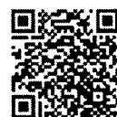
(ร่าง) แผนพัฒนา ฉบับที่ ๑๓ ฉบับปรับปรุง

๑.๓ (ร่าง) แผนพัฒนาเศรษฐกิจและสังคมแห่งชาติ ฉบับที่ ๑๓ (พ.ศ.๒๕๖๖ - ๒๕๗๐) สำนักงานฯ ได้นำ (ร่าง) แผนพัฒนาฯ ฉบับที่ ๑๓ ที่ผ่านความเห็นชอบของคณะรัฐมนตรี ตามมติเมื่อวันที่ ๓ พฤษภาคม ๒๕๖๕ โดยได้นำเสนอต่อที่ประชุมวุฒิสภา และสภาผู้แทนราษฎรเพื่อรับทราบ เมื่อวันที่ ๑๖ สิงหาคม ๒๕๖๕ และ ๒๕ สิงหาคม ๒๕๖๕ รวมทั้งได้นำความเห็นและข้อเสนอแนะของหน่วยงานต่าง ๆ เพื่อดำเนินการจัดทำ (ร่าง) แผนพัฒนาฯ ฉบับที่ ๑๓ (ฉบับปรับปรุง) ซึ่งคณะรัฐมนตรีได้มีมติเมื่อวันที่ ๓๐ สิงหาคม ๒๕๖๕ รับทราบและเห็นชอบตามที่สำนักงานฯ เสนอ โดยหลังจากนี้จะเป็นขั้นตอนการนำขึ้นทูลเกล้าฯ เพื่อลงพระปรมาภิไธย และคาดว่าจะประกาศใช้ได้ภายในวันที่ ๑ ตุลาคม ๒๕๖๕ ต่อไป พร้อมนี้ สำนักงานฯ ได้เสนอแนวทางการขับเคลื่อนและติดตามประเมินผลแผนพัฒนาเศรษฐกิจและสังคมแห่งชาติ ฉบับที่ ๑๓ (พ.ศ. ๒๕๖๖ - ๒๕๗๐) ไปสู่การปฏิบัติ ในคราวการประชุมคณะกรรมการยุทธศาสตร์ชาติ ครั้งที่ ๒/๒๕๖๕ เมื่อวันที่ ๒๒ สิงหาคม ๒๕๖๕ ประกอบด้วย (๑) คณะกรรมการขับเคลื่อนแผนพัฒนาฯ ฉบับที่ ๑๓ จำนวน ๕ คณะ มีอำนาจหน้าที่หลักในการกำหนดนโยบายและแนวทางในการขับเคลื่อนฯ ให้บรรลุผลสัมฤทธิ์ตามเป้าหมาย รวมถึงอำนาจการ สั่งการ กำกับดูแล ตรวจสอบและประเมินผลการดำเนินงานของส่วนราชการและองค์กรต่าง ๆ ที่เกี่ยวข้องให้ดำเนินงานตามนโยบายและแนวทางที่กำหนดไว้ (๒) กลไกการดำเนินงานตามภารกิจเพื่อสนับสนุนการบรรลุเป้าหมายยุทธศาสตร์ชาติ เพื่อถ่ายระดับของ