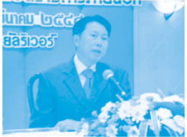
โดย เลขาธิการคณะรัฐมนตรี

เมื่อได้ทราบโครงสร้างการบริหารราชการแผ่นดินเช่นนี้แล้ว ไม่มีเรื่องใดที่เป็นราชการแผ่นดินสำคัญที่จะไม่ใช่พระราชอำนาจของพระมหากษัตริย์เลยแม้แต่เรื่องเดียว และจากการที่รัฐธรรมนูญบัญญัติให้มีผู้ตรวจการแผ่นดินของรัฐสภา (Ombudsman) ซึ่งในต่างประเทศบอกว่าของเขามีมาแต่ชานานนั้น หากพิจารณาจะเห็นว่าไทยมี Ombudsman มาแต่โบราณ ดีกว่าของต่างประเทศมาก ซึ่งก็คือสถาบันพระมหากษัตริย์นี้แหละ เป็น Ombudsman มาตั้งแต่สมัยสุโขทัย แม้ว่าบัดนี้รัฐธรรมนูญได้บัญญัติให้มีผู้ตรวจการแผ่นดินของรัฐสภาขึ้นมา เพื่อช่วยแบ่งเบาพระราชภาระไปบ้างก็ตาม แต่ก็ไม่ได้ตัดทอนพระราชอำนาจที่จะพิจารณาฎีกาทั้งหลายเลยแม้แต่หยด